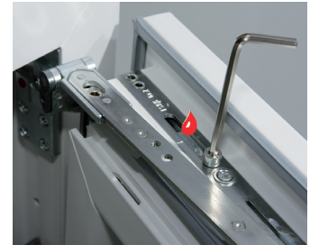
Flügelandruckeinstellung an der Schere oben +/- 1 mm