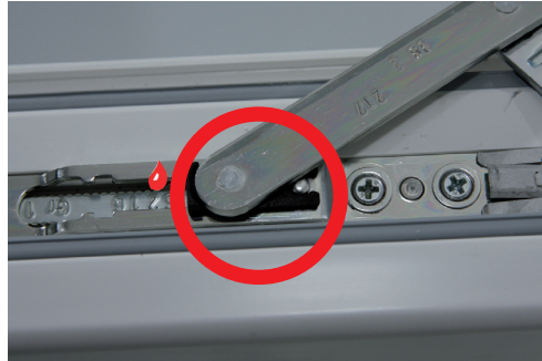
ZUSCHLAGSICHERUNG (oben) Vermeidet, daß gekipptes Fenster bei Zugluft zuschlägt