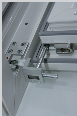
2. Flügel einhängen, Flügel in den Achsstift einführen