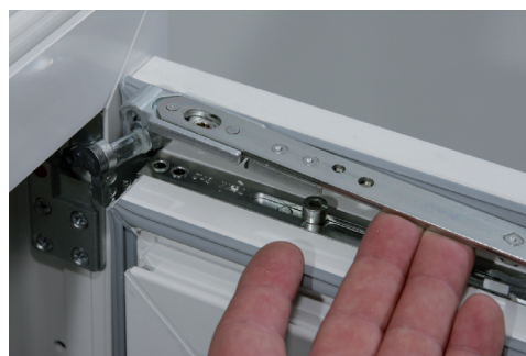
4. Schere aushängen, Flügel leicht anheben, Schere entlasten, Scherenarm nach oben ausheben