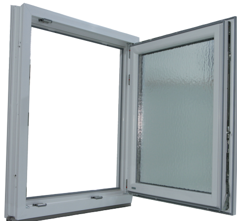
2. Fenster öffnen