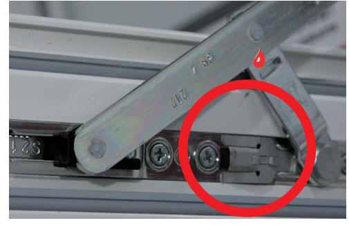
SCHALTSPERRE IN KIPPSTELLUNG (oben) Verhindert Fehlbedienung des gekippten Flügels