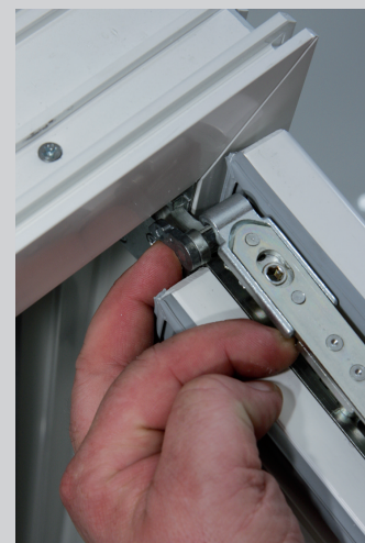
3. Scherenarm einhängen und Arretierhebel schließen (per Hand oder mit Inbusschlüssel 4 mm)