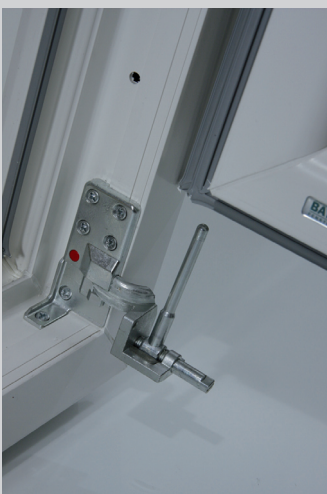
1. Sicherheits-Tresorband unten in 90° Stellung drehen und Achsstift bis zu Anschlag neigen