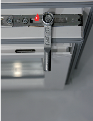
SICHERHEITS-PILZZAPFEN Flügelandruckeinstellung (SW 11) +/- 1 mm