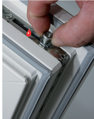
SICHERHEITS-PILZZAPFEN Automatische Höheneinstellung zum Falzluftausgleich bzw. durch Handeinstellung + 2,5 mm