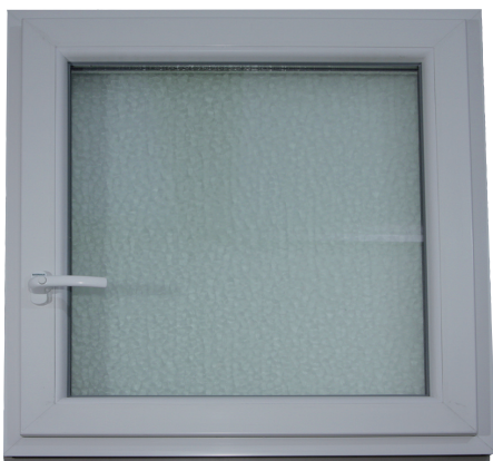
1. Fenstergriff in Drehstellung bringen (Griff waagrecht)