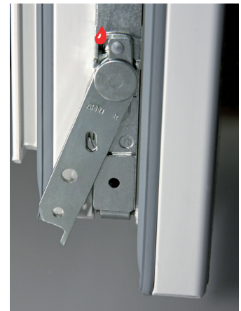
FLÜGELHEBER hebt automatisch beim Kippen und Schließen den Flügel an, generelle Entlastung des Flügels