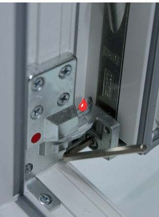
Seitenverstellung unten +/- 2 mm