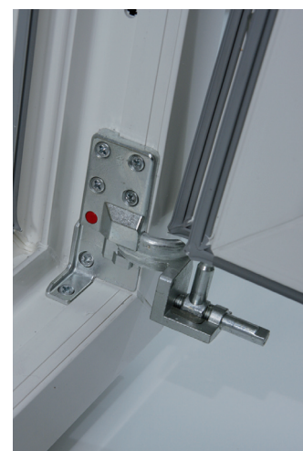
5. Flügel leicht anheben ca. 20 mm, dann neigen und herausziehen