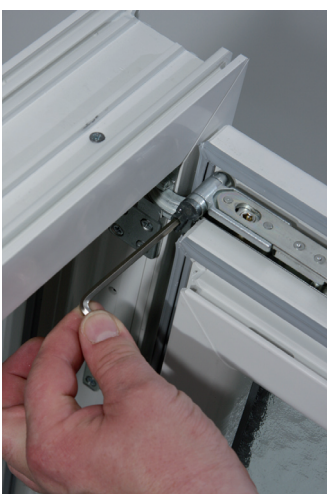
3. Am Sicherheits-Tresorband oben den Verriegelungshebel öffnen (per Hand oder mit Inbusschlüssel 4 mm)