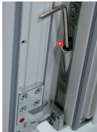
Höhenverstellung +/- 2 mm