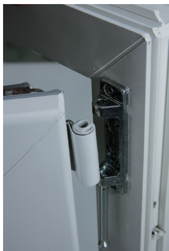
5. Fenster oben, bei Bandlenker, herausziehen