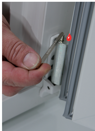
Höhenverstellung +/- 2 mm