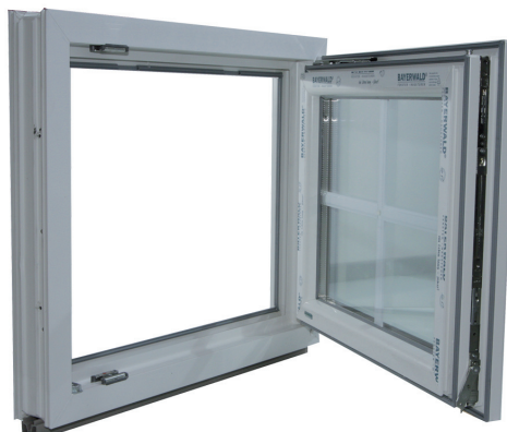
2. Fenster öffnen