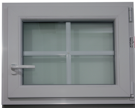
1. Fenstergriff in Drehstellung bringen (Griff waagrecht)