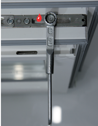
SICHERHEITS-PILZZAPFEN Flügelandruckeinstellung (SW 11) +/- 1 mm

BAYERWALD® FENSTER + HAUSTÜREN ein Leben lang - sicher!