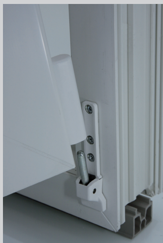
1. Flügel im unteren Ecklager einführen