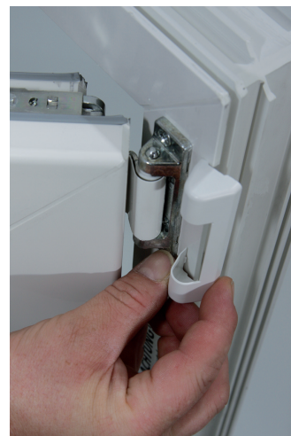
3. Beschlagsabdeckung oben entfernen