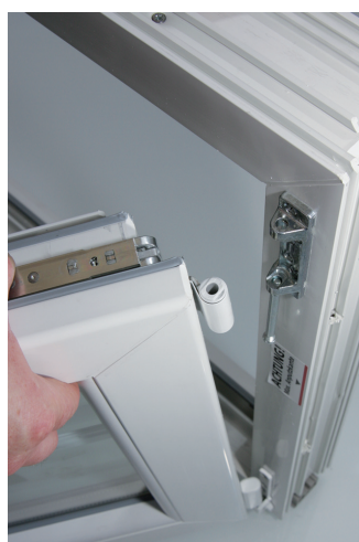
6. Flügel etwas neigen