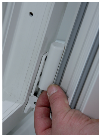
Höhenverstellung Beschlagsabdeckung entfernen