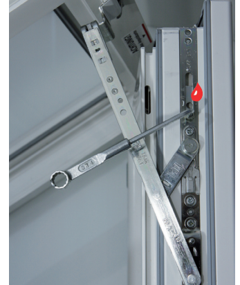
Flügelandruckeinstellung an der Schere oben +/- 1 mm