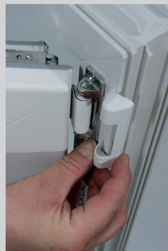
4. Beschlagsabdeckung oben wieder anbringen