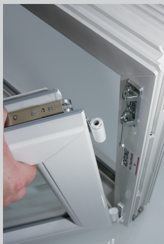
2. Eckband in Bandlager einführen (gleiche Position wie beim Einhängen)