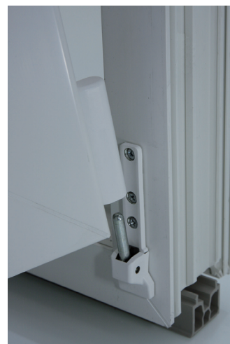
7. Flügel aus Ecklager unten heraus ziehen