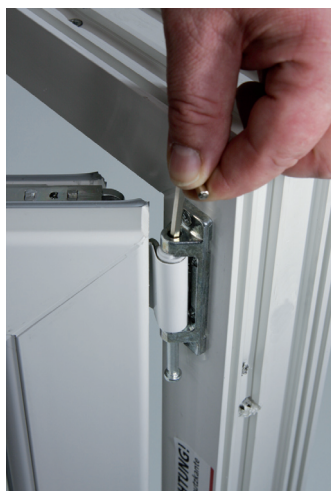
4. Scherenlager oben, Sicherungsbolzen nach unten entfernen (mit Inbusschlüssel 4 mm)