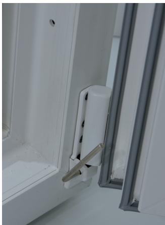
Seitenverstellung unten +/- 2 mm