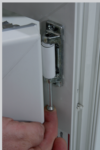
3. Sicherungsbolzen eindrücken