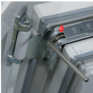
Seitenverstellung oben +/- 2 mm